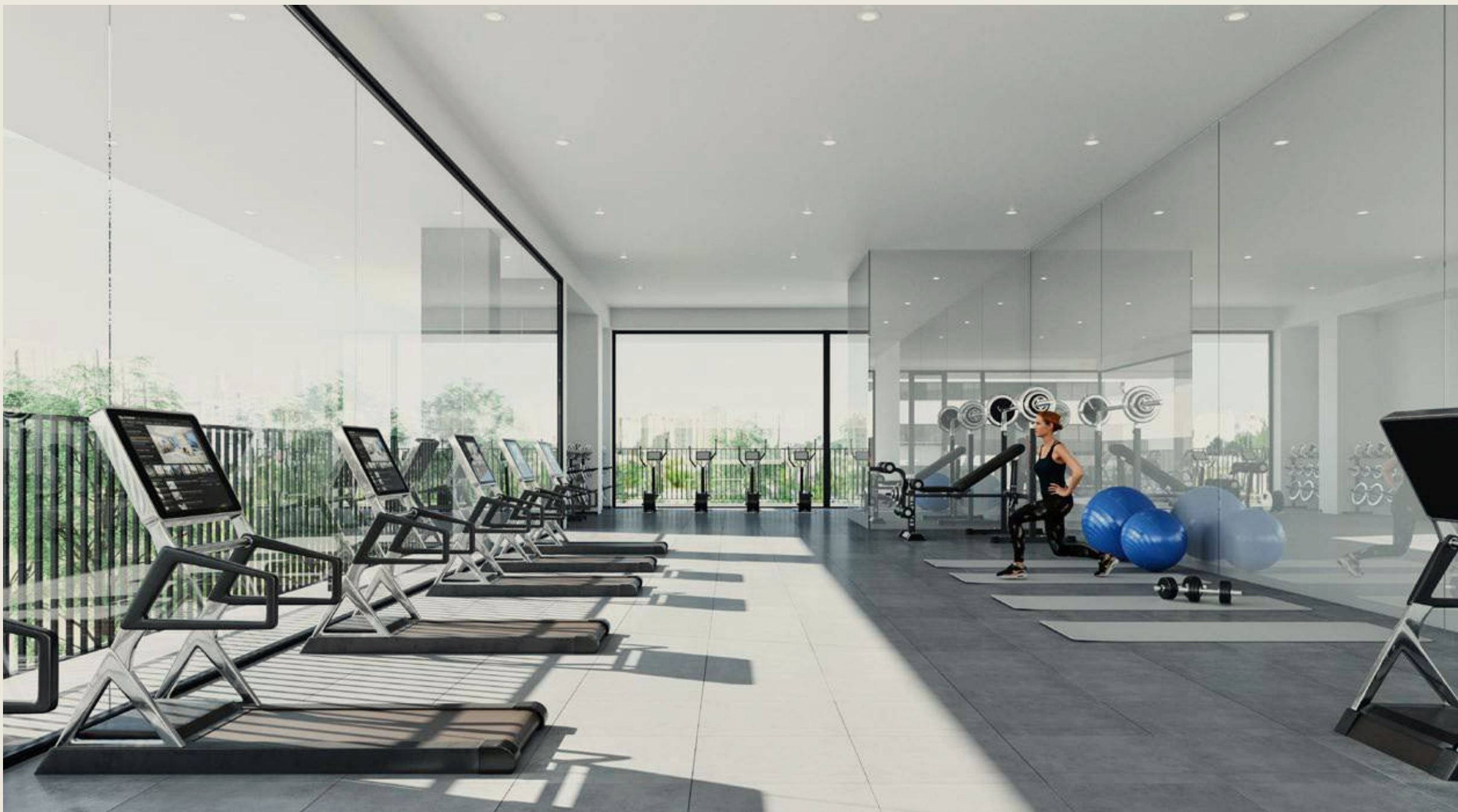
Blocos A, B e C Blocks A, B and C