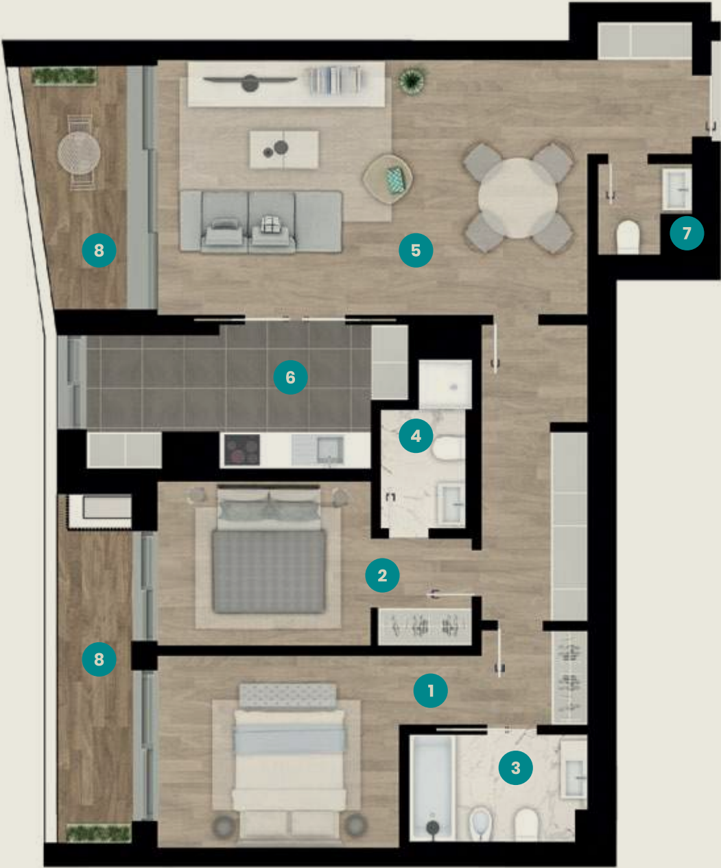
Andar modelo (T2) Showroom apartment (2 bedroom)