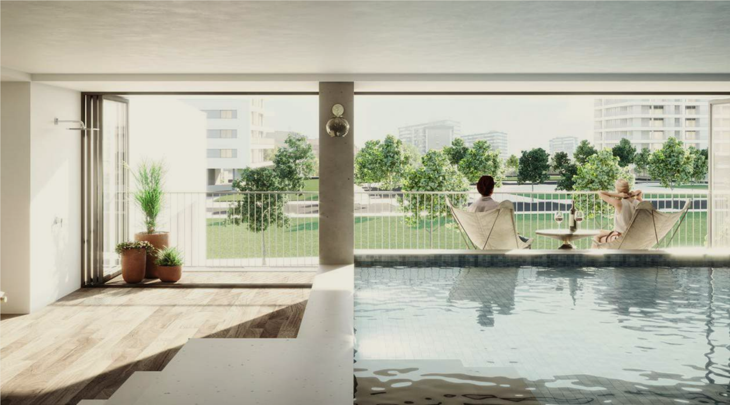
Bloco C Block C